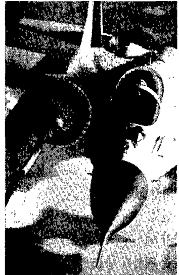
인도네시아는 MiG-29의 기술도입을 고려중이다.

보잉사의 대변인은 타당성조사에만 약 1년반 정도의 기간이 소요될 것이라고 밝혔다. 착공이 확정되면 크베너사는 플랫폼 건설을, 보잉사는 비행통제 및 전기 시스템 구축공사를 맡을 예정이다.