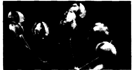
▼ 누리장나무의 익기전 열매

열매의 모양은 마치 부녀자들의 장신구(裝身具)인 브로치(Broach), 귀고리 등과 같은 악세서리처럼 화려하고 아름다워서 조경수로서의 활용성은 부족함이 없으며, 각종 정원, 도로 및 철로 변의 녹지대, 공원 등에 단목(單木) 식재를 하여도 좋고, 공간이 넓으면 집단(集團) 식재를 하여도 좋을 것이다.