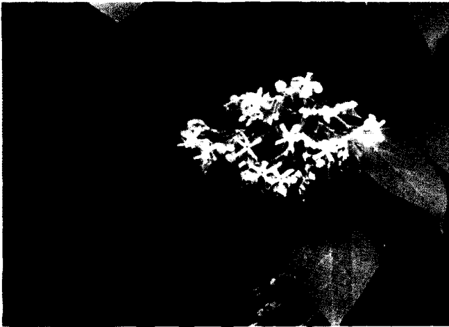
◀ 누리장나무의 화서