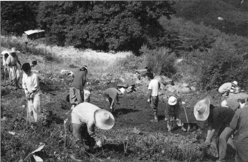
농업이 중심이 되는 '생태공동체'에 대한 관심이 부쩍 높아졌다.

9월호까지 통권 16호를 냈다. 발행부수는 만 5천부. 매달 이철수씨의 판화그림 표지를 만나는 감동도 예사롭지 않다.