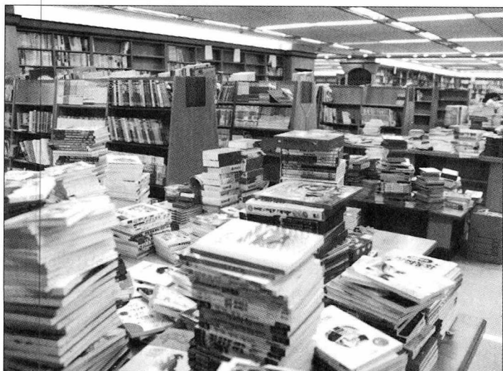
6월 21일 개점을 앞두고 서가 단장이 한창이다.

100평 규모의 씨티문고 2호점은 성북구 돈암동에 내년 2월쯤 선보이게 된다. 성신여대를 중심으로 형성된 새로운 ‘젊은이의 거리’에 ‘책방’은 또다른 활력을 불어넣으리란 게 송사장의 예감이다. 이제 서점은 젊은이의 문화에서 빼놓을 수 없는 매력적인 공간이기 때문이다. — 김지원 기자