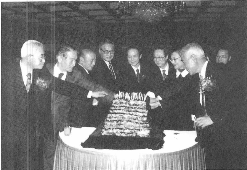
지난 3월 15일 세종문화회관에서 가진 기념행사 중 '시루떡 자르기'의 축하연.

그림엽서 <화실 밖의 풍경>을 좋아하는 것도, 창 밖의 풍경을 좋아하는 것도 자연을 아름답게 보는 눈, 아름답게 생각하는 마음의 눈에서 시작된 것이 아닐까? ❖