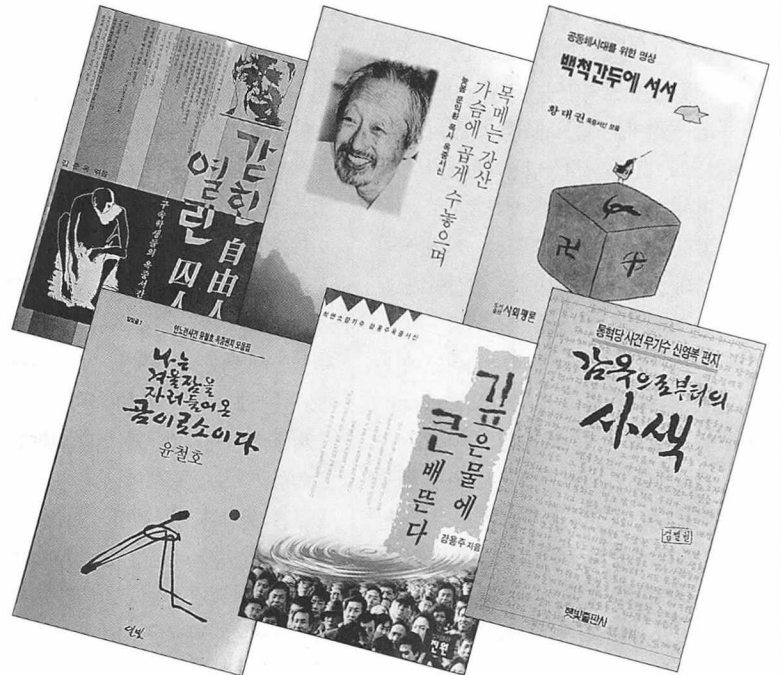
감옥에서의 사색을 담은 서간집은 고통의 환경 속에서 나온 평화의 메시지로 읽힌다.

올리고 있다. 옆사람의 체온으로 추위를 이기는 겨울철의 원시적 우정과 극명한 대조를 이루는 ‘여름 징역살이’에 대한 통찰을 통해 그는, 가장 가까이 있는 사람에게 겨워지는 부당한 증오심의 해악을 일깨운다. 또한 병상에 있는 어머니에게는 “기다린다는 것은 모든 것을 참고 견디게 하고, 생각을 골똘히 갖게 할 뿐 아니라, 무엇보다 자기의 자리 하나 굳건히 지키게 해주는 옹이같은 단단한 마음입니다”라고 위무한다.