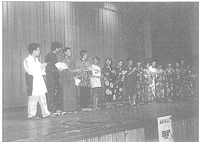
문화행사에서 공연을 마치고 인사를 하는 일본학생 대표단

이들의 모임은 어떤 정책을 논한다거나 회원의 이익을 우선시하는 기성인들의 단체가 아닌 말그대로 순수한 젊은 학생들의 결사체로 조직의 완벽함이나 넉넉한 재정 등이 보장된 것이 아니기에 여러 형태의 어려움이 있는 것으로 알려져 있다.