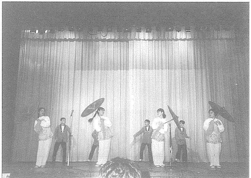
제24회 APDSA에는 많은 대학생들이 참여해 서로를 이해하는 한편 우정을 나눴다.

대학생들로서는 적지 않은 경비와 시간을 투자 한다는 것이 분명 쉬운 일은 아닐 것이며 개인적인 희생도 뒤따를 것으로 생각되지만 돈주기도 못산다는 젊음이 그들에게는 무엇과도 바꿀 수 없는 소중한 자산이며 이번 행사는 그러한 그들에게 경험이라는 또 하나의 새로운 가치를 부여한 좋은 기회로 각자의 마음에 각인될 것이다.