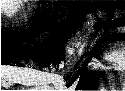
Fig. 1. Erosive and hyperkeratotic plaque like white lesion on skin and mucous membrane of inner side of lower lip.

통증이 없었으나 1년 후부터 경한 통증이 생겼고 조직 검사상 백판증(leukoplakia)로 진단 받았다. 1년 간격으로 조직검사를 시행하였는데 93년 10월에 입술과 구강내 병소가 verrucous carcinoma로 진행되었다. 95년 봄에 좌측 귀와 안면부의 통증이 있어 이비인후과, 구강외과에 자문한 결과 상악 좌측 제 1 소구치의 치아우식증과 치근단 농양으로 인한 통증으로 사료되어 발치 하였으나 통증은 여전하였다. 환자의 구강병변에 대한 치료로 그동안 피부과에서는 triamcinolone acetonide을 국소부위에 주사하였고, gentian violet, nizoral, potassium hydroxide, cafergot, diazepam 2 mg/tab등으로 치료하였었고 최종진단은 구강내 편평태선과 조기 사마귀양암(lichen planus, early verrucous carcinoma) 이었다.