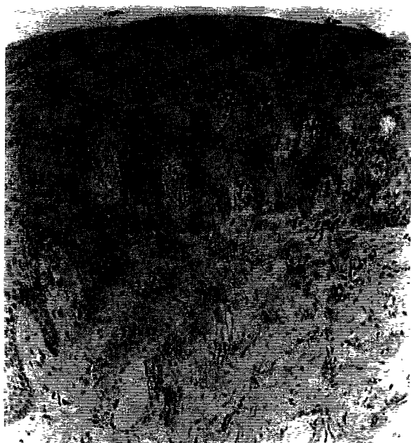
Fig. 2. 면역조직화학적 염색법상 정상치은상피에서의 EGFR 단백질의 발현(×100). 염색이 주로 각화층과 과립층에 국한되어 있다