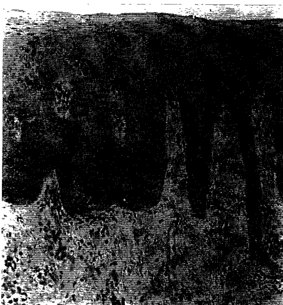
Fig. 3. 동소 mRNA 보합결합법상 염증성 치은 상피에서 EGFR mRNA의 발현(×100). 염색이 각화층을 제외한 전층에 걸쳐서 균일하게 분포되어있다.