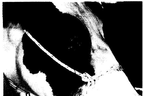
Fig 1. A holstein cow had squamous cell carcinoma of right lower eyelid and periocular area.

환축의 vital sign은 체온이 38.2°C, 심박수가 67회/분, 호흡수가 18회/분이었으며 안검 자극과 증생으로 인하여 각결막을 자극하여 눈을 자주 깜박거리고 우