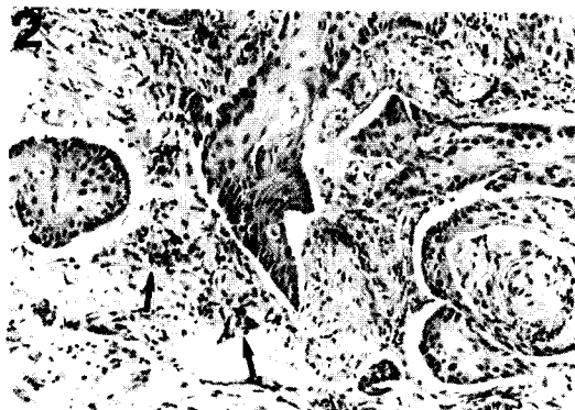
Fig 2. Squamous cell carcinoma from the limbus of 10-year-old holstein cow. Invasive cords and masses of neoplastic squamous cells were revealed. Note the mitotic figures and hyperchromatism (arrow). H & E stain; \times 225 .