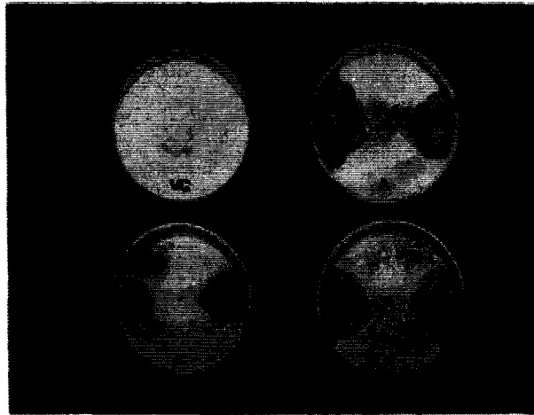
Fig. 2. Inhibition effects of antifungal bacteria CAP 141(A) against apple pathogen, Valsa ceratosperma (VC) on Potato Dextrose Agar plate for 7 days at 28°C.

전남 장성과 영암군의 사과 생산단지를 중심으로 토양이나 잎에서 분리한 미생물 3,000여종 가운데 사과 부란병원균에 대한 길항미생물을 선발한 결과는 그림 2에 나타내었다. 그림에서 보는 바와같이 길항균 CAP141의 길항력이 가장 우수한 것으로 나타났으며 다른 길항균들도 어느정도의 길항력을 보여주었다.