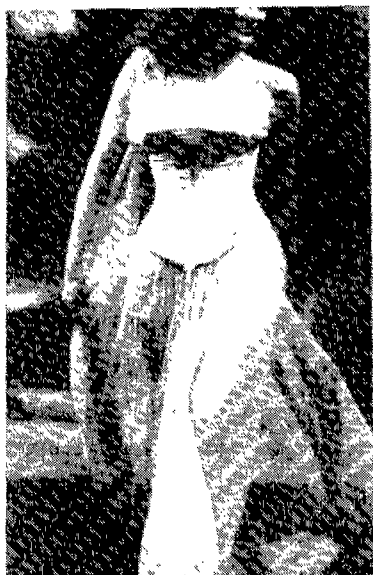
<그림 5> 코르셋 드레스, Soen Eye No. 8, 1992

코르셋의 걸옷화 유형 중에서 코르셋을 현대화한 디자인으로 많이 표현되는 양식은 <그림 5>와 같이 역사 속의 코르셋/부스티에를 그대로 재현한 드레스나 탑이다.