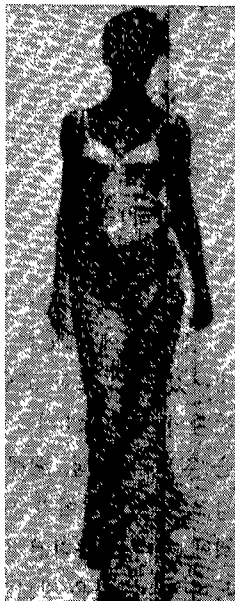
〈그림 13〉 슬립드레스 1 Moda In N. 103, 1997

〈그림 12〉는 레이스 소재로 신체의 곡선과 가슴, 배꼽 등을 드러내고 안에 입은 검정색 쇼츠는 그대로 드러나 속옷과 걸옷의 경계를 허물고 있다.