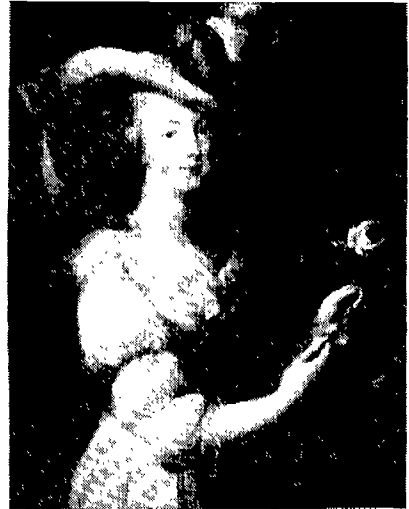
〈그림 2〉 슈미즈를 차림의 Marie Antoinette, 1783 Infra-Apparel

현재까지의 복식의 역사를 고찰해 볼 때 속옷이 경우에 따라 걸옷으로 가시화 된다거나 걸옷이 속옷으로 기능이 전이된 경우를 쉽게 찾아볼 수 없