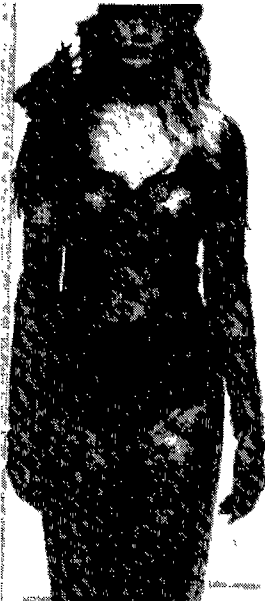
〈그림 12〉 에로티시즘을 강조한 시-쓰루 룩 Moda In N. 102, 1997

소재에 의해 신체가 노출되는 시-쓰루 룩은 투명한 옷감을 통해 여성의 아름다운 피부를 드러내는 것을 말하며 1960년대 중반에 출현해 1980년대 초반에 강세를 보인바 있다. 35) 속옷의 특성상 속옷의 소재로 가장 가볍고 얇은 옷감이 선호되었는데 얇아서 몸매를 드러내던 이러한 소재가 바로 걸옷으로 변용된 것이다.