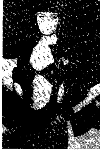
〈그림 10〉 브라, 쇼츠의 겉옷화, Fashions of a Decade : The 1990s

도 시도되어 왔으나 대중에게 일상복으로 받아들여진 것은 마돈나의 노출 이후이다.