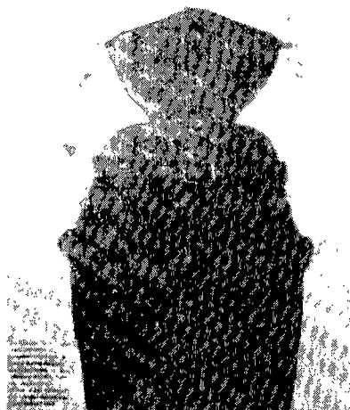
<그림 6> 코르셋을 입은 남성, Vogue U.S.A 1995년 12월호

골티에가 마돈나의 무대의상 등에서 보여준 충격은 비밀스러운 속옷을 공식적인 무대라는 외부로 드러냄을 통해 기존의 옷에 있어 안과 밖의 개념이 무너짐으로서 파생된다. 그 충격은 양면적으로 마치 판도라 상자가 열려졌을 때 쏟아져 나온 것들에 대한 당혹스런 고통감과 굳게 잠겨있던 신비가 풀렸을 때 느껴지는 해소감의 이율배반등은 의복의 완전한 존재성에 대해 우리가 갖는 기대감에 대해 일종의 폭력적 해체행위를 보여주는 것이다. 25)