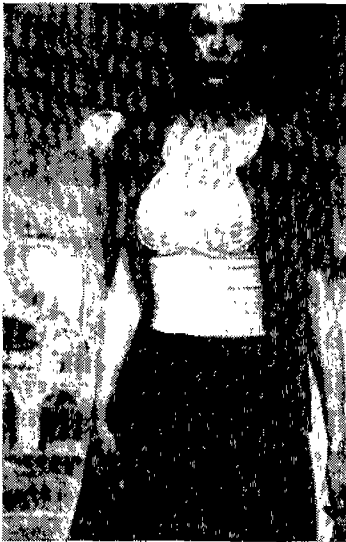
〈그림 7〉 겹옷화 한 속옷, Moda In N. 100, 1996

19세기 후반 자유주의 페미니스트들은 의상개혁 운동을 통하여 패셔너블한 의상을 벗어버리고 남성적인 의상을 착용함으로써 남성과 사회적으로 대등한 위치를 확보하려고 시도하였었는데, 26) 이성인 남성을 유혹하려는 성적인 도구인 코르셋을 20세기 후반에 남성이 착용하였다는 것은 의미 있는 일이다.