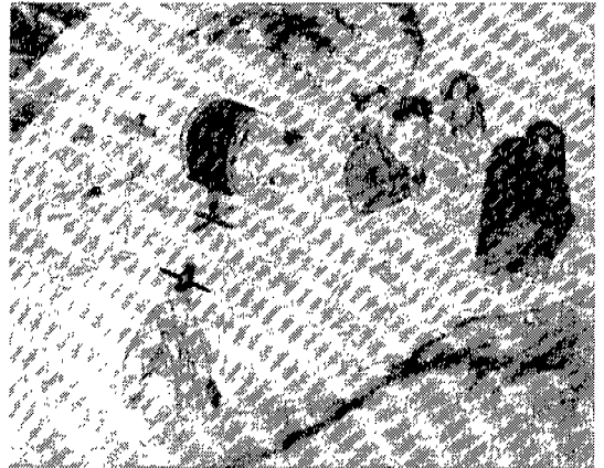
<그림 3> 걸옷으로 드러난 속바지, 18C 혜원 풍속화, 「한국유물오천년」

복식의 양식은 그 문화권의 사상, 철학, 종교를 바탕으로 이루어져, 동양과 서양은 미의식의 구조가 다르고 심미(審美)의 사고방식 또한 다르며 미적가치 기준이 다르기 때문에 동서양 복식의 외적조형이 다르며 그 내적 표현미 또한 다른 가치를 지니고 있는데, 21) 한국복식에서도 속옷을 걸옷으로 드러내 입은 착장을 18세기의 풍속화에서 찾아볼 수 있다. <그림 3>을 보면 걸치마를 걷어올려 속에 입은 속바지를 걸옷으로 드러나게 입은 모습을 볼 수 있으며 회화 속의 여인은 기녀로 보이나 이러한 착장 모습은 일반 여성에게서도 볼 수 있어 당시대의 유행현상으로 보여진다.