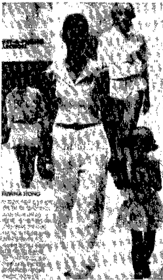
<그림 11> 속옷 같은 겉옷, 1997 Elle 한국판, 96년 12월호

또한 운동복(Active Sports Wear)이나 휴양복(Resort Wear) 등으로 입혀지던 쇼트팬츠는 짧아질때로 짧아져 팬티와 반바지의 경계를 무너뜨리며 일상복화하고 있다. 종래의 반바지는 짧아도 가랑이를 가지고 있었으나 이제는 <그림 10>에서 보는 것과 같이 가랑이가 없는 팬츠(속옷)의 형태도 일상복으로 입혀지고 있다.