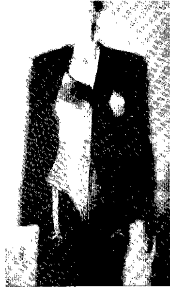
<그림 4> 겉옷 위에 입은 속옷, 1990 Infra-Apparel

‘우리 시대의 패션에 터부란 없다. 속옷의 아름다움을 감추어 두는 것은 아까운 일이다.’고 말해왔던 고티에는 1990년 스트라이프 검정색 울 슈트 위에 핑크 색 새틴의 신축성있는 코르셋을 덧입는 디자인을 발표하였다. 원추형으로 가슴을 강조하고 바디슈트의 아래에는 가터 벨트(garter belt)로 장식한 <그림 4>는 코르셋이나 가터 벨트가 지닌 본래의 기능에서 의복의 장식적인 요소로 변화한 예이며, 속옷 위에 겉옷이라는 고정관념을 무너뜨리는 것이었다. 겉옷 위에 입은 속옷은 더 이상 속옷이 아니라 겉옷으로 그 기능이 전이된 것을 볼 수 있으며, 이제는 겉옷이다. 속옷이다 하는 구분조차 필요하지 않은 듯하다.