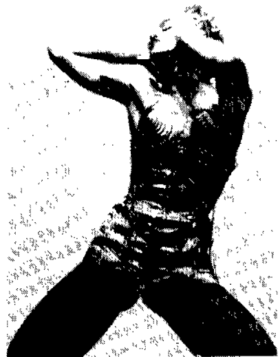
<그림 1> '코르셋' 무대의상, Madonna, 1990 Jean Paul Gaultier

물론 엄밀하게 따져서 장 폴 골티에나 마돈나가 속옷의 걸옷화를 시도한 최초의 인물은 아니다. 장 폴 골티에만 하더라도 1983년 봄 여름 컬렉션에서 코르셋을 모티브로 한 드레스를 이미 발표했