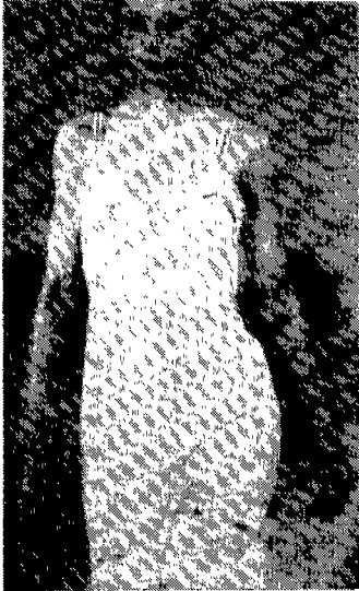
〈그림 14〉 슬립드레스 2 Moda In N. 100, 1996

여 주인공이 입고있는 하늘거리는 튜닉을 모티브로 하고 있는 드레스이다. 과거의 아름다움을 섬세하고 순수하게 표현하여 38) 로맨틱한 분위기를 자아낸다.