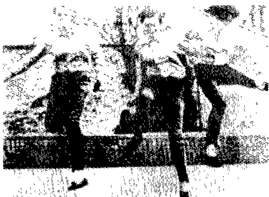
(그림 6) 유니섹스룩 David Bond 저, 정현숙역 20세기 패션 p.202.

모즈 패션은 뮤직 스타 엘비스의 영향, 여성 해방 운동으로 인한 기계화, 핵 가족화 등에 따라 과거 남성복에서 많은 것을 취한 유니섹스의 선구였다. 여성은 유니섹스룩의 남성다운 스타일을 착용했고, 성의 혼돈은 여성해방을 가져왔다. 모즈 여성은 힙스터 바지와 남성용 셔츠(그림 6), 남성용과 같은 구두, 귀가 보일 정도의 짧은 머리를 하고, 청바지 위에 더블 코트 등을 착용하였다.