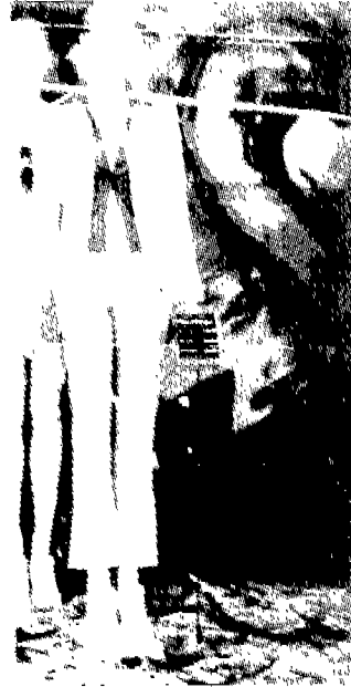
(그림 12) 힙스터바지와 폴로셔츠 Inter fashion planning '96, Street Fashion Report 8, p.24.

택있는 소재를 이용하여 섹시하면서도 심플하다. '60년대 힙스터 바지와 셔츠를 더욱 모던한 느낌으로 표현한 스타일(그림 12)은 '90년대 들어 젊은이들의 스트리트 패션에서 많이 보여지고 있다.