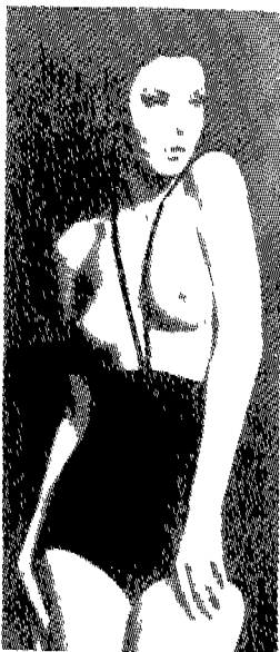
(그림 5) 탑레스 수영복 Amy De La Haye Fashion Source Book, p.137.

이렇듯 60년대의 문화를 대표하는 모즈는 젊은 이들 문화에 커다란 영향을 주면서 대중 문화에도 크게 반영된 한 시대를 대표하였던 문화 사조라고 할 수 있다.