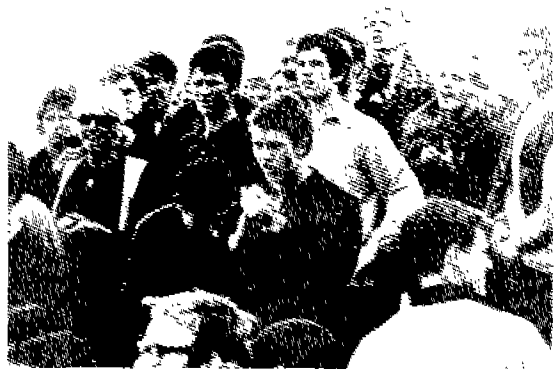
(그림 10) 캐주얼웨어를 입은 모즈 Amy De La Haye Fashion Source Book, p.140.