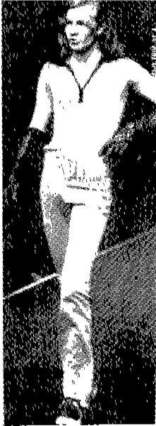
(그림 13) 페티시즘룩 Yoshiyuki Konishi '96 N.Y/ T.K, s/ s, Collec- tion, p.246.