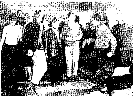
(그림 9) 클럽에서 춤추는 모즈 Barnes Richard Mods, p.52.

19세기 중반에 리바이 스트라우스(Levi Strauss)가 미국의 광부들을 위해 만든 값이 싸고 튼튼한 노동복인 청바지는 23) 실용적인 것을 좋아하는 모즈에게 사랑을 받았다. 또한 클럽(Club)을 중심으로 활동했던 모즈(그림 9) 24) 는 가디건과 스포티한 폴로셔츠의 캐주얼 웨어(그림 10)를 착용했으며, 25) 스쿠터를 즐기던 모즈는 모자가 달린 아노락 파카(Anorak parka, 그림 11)를 많이 착용하였다. 26)