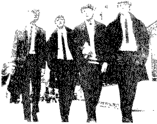
(그림 2) 비틀즈 Elle, '96 s/ s, 5, p.98.