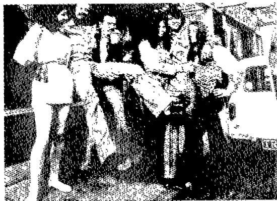
(그림 7) 페티시즘룩 Ted Polhemus Street style, p.61.

'60년대 성의 질서에 대한 도전은 청소년 하위 문화의 탄생과 함께 시도되어 표면화되기 시작 하였으며, 특히 모즈에게 있어서의 그러한 도전은 남성에게 페티시즘 양상인 여성 스타일의 표현을 구체화시켰다. 특히 카나비 스트리트의 모즈 남성은 더욱 여성적이고 화려한 옷(그림 7)을 입었으며 19) 여성적인 색상이나 긴머리를 선택함으로써