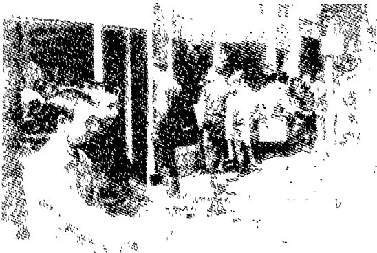
(그림 1) 카나비 스트리트의 모즈 ted Polhemus Street style, p.50.

‘모즈(Mods)’란 ‘모던즈(Moderns)’의 약자로 1950년대 말부터 1960년 후반까지 런던의 카나비 스트리트를 중심으로 나타난 비트 그룹(그림 1)으로, 당시의 록 뮤직(Rock Music)과 밀접한 관계를 가졌으며 이들의 옷차림을 ‘모즈룩(Mods Look)’이라 한다. 4) 모즈를 일컫는 말로는, Mids, Mockers, Moddy Boys, Scooter Boys 등이 있으며 5) 모즈 스타일은 대중, 대량문화, 플라스틱, 모조문화로, 소비문화시기였던 1950년대말 노동자계층의 청소년과 미술대학생들에 의해 영국을 중심으로 퍼지기 시작했다. 6)