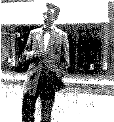
(그림 3) 테디보이 스타일 Amy De La Haye Fashion Source Book, p.101.

초기 모즈의 의복 형태는 에드워드 왕조 스타일을 흉내낸 테디보이(Teddy Boys) 스타일(그림 3)이었으나 후기에는 광택있는 재킷, 좁은 칼라의 셔츠, 끝이 뾰족한 구두로 남의 옷을 입은 듯한 어색한 모즈룩을 표현 하였다.