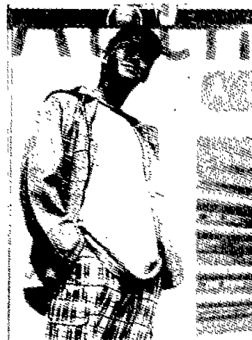
(그림 15) '60년대 북고풍의 아노락 파카 (Anorak parka) Inter fashion planning, Fair report, p.7.

캐주얼하면서 몸에 피트되는 힙헹거 팬츠와 셔츠, '60년대 스쿠터와 함께 착용했던 아노락 파카가 부활되어 유행되고 있다. (그림 15) 그 외에도 가죽