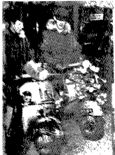
(그림 11) 아노락 파카를 입은 모즈 Barnes Richard Mods, p.83.

모즈가 애용하던 초스피드의 스쿠터는 죽음을 두려워하고 있지 않다는 위협 내지는 죽음에 초연한 우월감의 상징이었다. 이는 현대 문명에서 인간상실의 소외감에 대한 반항의 일면이었던 것이다. 27)