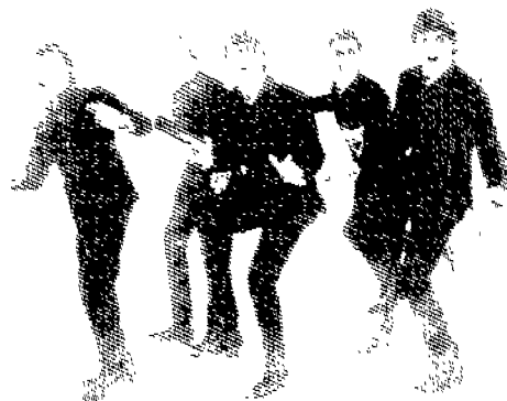
(그림 8) Less is more 스타일 Ted Polhemus Street Style, p.51.