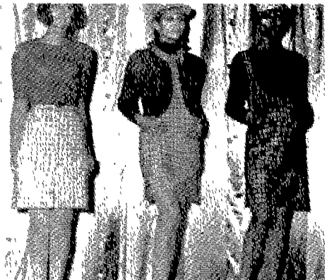
(그림 4) 마리퀴트의 진저그룹 Amy De La Haye Fashion Source Book, p.128.

이러한 모즈 패션은 일부 기성인에게 비난과 조소를 받았지만 마리 퀴트(Mary Quant)나 젠드라 로즈(Zandra Rhodes)등의 디자이너는 자신들의 작품세계에 고양화 시켰고, 피에르 가르탱(Pierre Cardin), 루이스 페레(Louis Féraud), Yves Saint Laurent)등도 모즈 패션을 하이 패션으로 소화 시켰다. 14) 미니 스커트의 대명사로 알려져 있는 영국의 마리퀴트(Mary Quant)는 1963년 진저 그룹(Ginger group)을 설립 하였고(그림 4), 청소년 하위 문화의 전위 집단인 모즈 패션에 심취하고 있었다. 15)