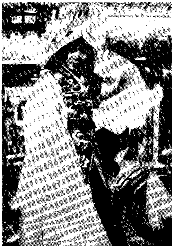
〈그림 1〉 불사장삼 (1994년 현존 무인의 무복)

고 깃도 쌍깃으로 되어 있으며 소매의 팔꿈치 부분이 트여 있는 것을 착용하기도 하였다. 〈그림 1〉