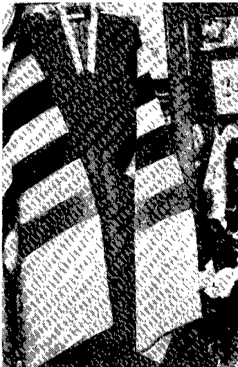
〈그림 8〉 별상의대 (1994년 현존 무인의 무복)