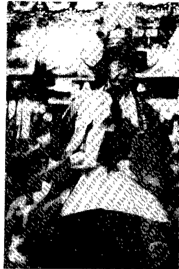
<그림 5> 원삼 (1994년 현존 무인의 무복)

制度에 변화가 있어 쌍깃과 흰색의 동정이 달린 것을 대부분의 巫인들이 巫服으로 착용하고 있다.