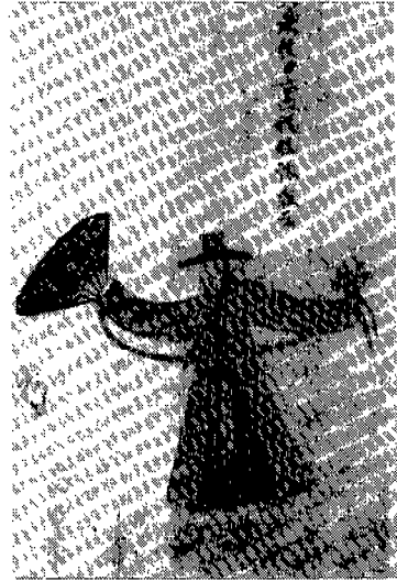
〈그림 7〉 소창의 (1800년대 巫黨來歷)