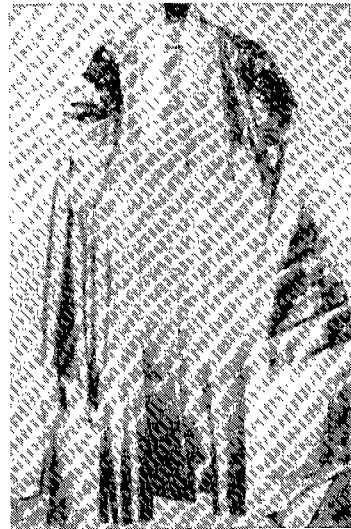
〈그림 9〉 성전의대 (1994년 현존 무인의 무복)

그외에도 長衣〈그림 6〉나 小髷衣〈그림 7〉가 무복으로 착용되었는데, 이들은 조선시대에도 巫服으로 착용되었다.