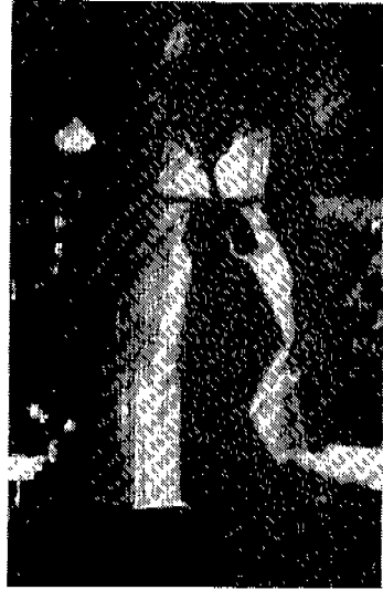
<그림 3> 구군복 (1994년 현존 무인의 무복)