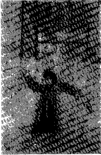
〈그림 6〉 장 의 (1980년대 巫黨來歷)