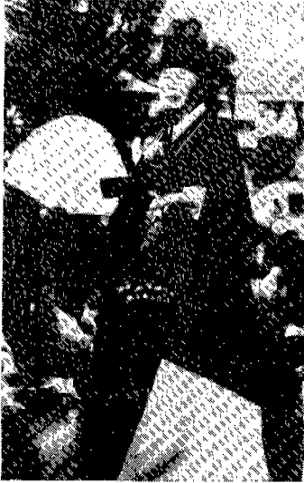
<그림 2> 철릭 (1994년 현존 무인의 무복)