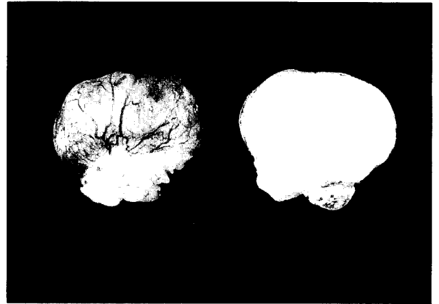
Fig. 3. Gross findings including cut-section of tumor showed homogenous, yellowish, round mass.

의 종괴가 기관내강에만 위치하고 있으며 기관주위조직으로 침윤등 악성을 시사하는 소견은 없었다. 밀도측정상 저밀도(-107, -47HU)를 보여 양성 지방종을 의심하였다(Fig. 1). 기관지내시경 검사상 종괴는 기관중간부위에 5시 방향에 유경성의 노란색의 구형이 관찰되었으며, 종양표면의 점막은 괴사나 궤양등은 없이 정상 소견을 보였고, 점막하 확장된 혈관을 관찰할 수 있었으며 내시경으로 종