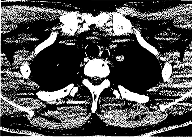
Fig. 1. Chest CT scan showed the round, peduculated mass with characteristic hypodensity, which was located in the mid-portion of intrathoracic trachea, occluding the most lumen of trachea.