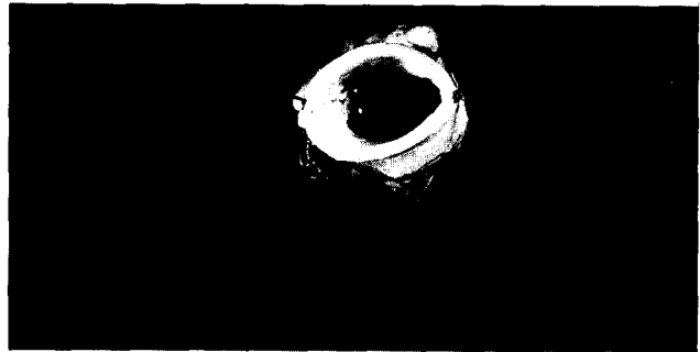
Size-reduced allograft and coaptation of two leaflets

국내 동종이식술의 현황은 구미 각국에 비해 아직 보편화되지 못하고 있는 실정으로 1980년대 후반에 들어서면서부터 소수의 임상 적용사례 및 동물실험결과 등이 발표되기 시작하였다 12~14) . 이러한 배경에는 사체손상을 금기시하는 오랜 사회관습과 뇌사를 사망으로 인정하지 않는 등의 특수한 사정으로 동종이식편의 획득이 어려웠던 점