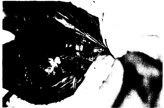
Fig. 2. Operative view. The forcep indicates the trachea which was incised longitudinally.

도자상 폐동맥압은 60/34/57 mmHg, Qp/Qs = 2였다. 검사실 소견은 동맥혈 가스 분석 소견이 대기에서 pH 7.33, PO 2 47 mmHg, PCO 2 24 mmHg, 산소 포화도 79.5%였고, 혈색소는 9.9 g/dL였으며 그의 별다른 이상 소견은 없었다.