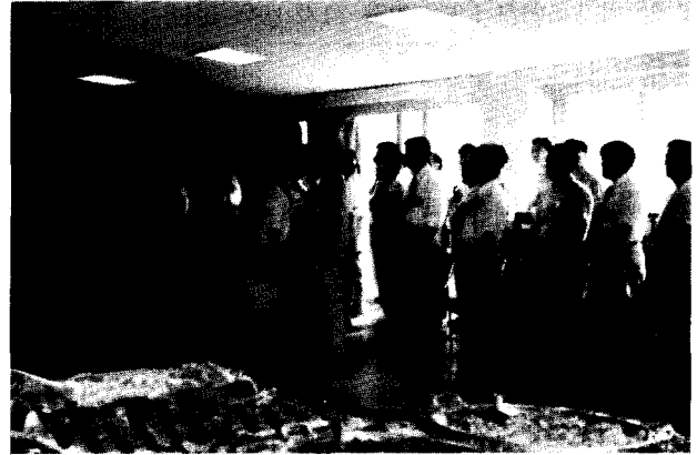
< 전야제에 참석한 회원들 >