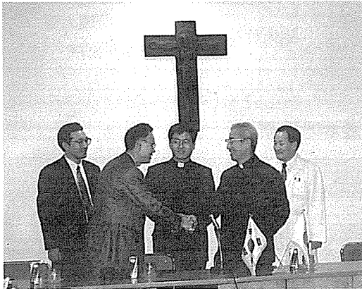
일본 가톨릭의료시설협회 한국순례단