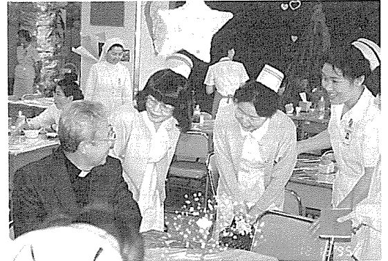
일본 간호사들이 강남성모병원에서 연수중 간호사회가 마련한 자선 찾집에서...