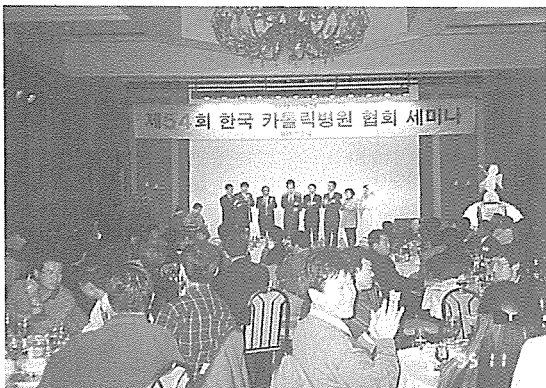
1995년 가을세미나 친교의 시간