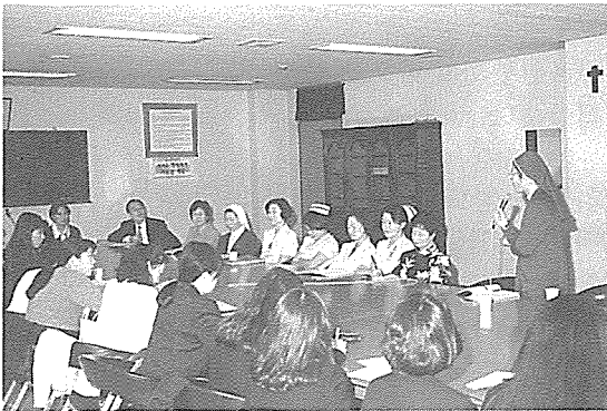
일본 간호대학생들이 임상 실습을 마치고...