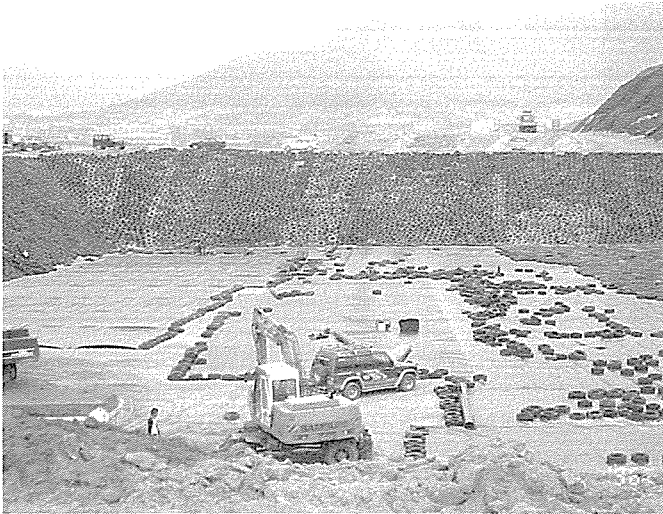
[일반폐기물 매립장 준설 1차공사 경사면에 페타이어를 깔고 바닥공사중임]