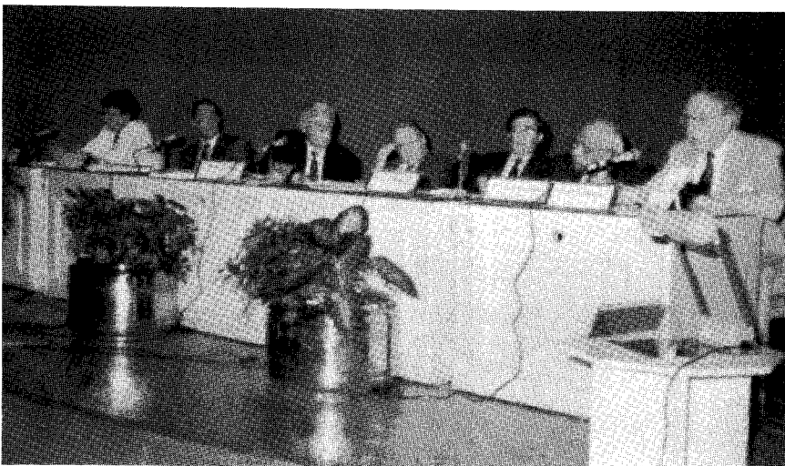
식량안정에 관한 ICID-FAO 특별회의 모습

세계 식량 정상회담이 1996년 11월 13일부터 11월 17일까지 이탈리아 로마의 FAO본부에서 개최되었으며, 또한 이와 때를 맞추어 1996년 11월 11일부터 17일까지 비정부기구 모임이 개최되었다. FAO는 ICID에 세계 식량 정상회담의 옵저버로 3인 이내의 대표자를 보내주도록 요청하였으며, ICID는 1996년 9월 카이로에서 개최된