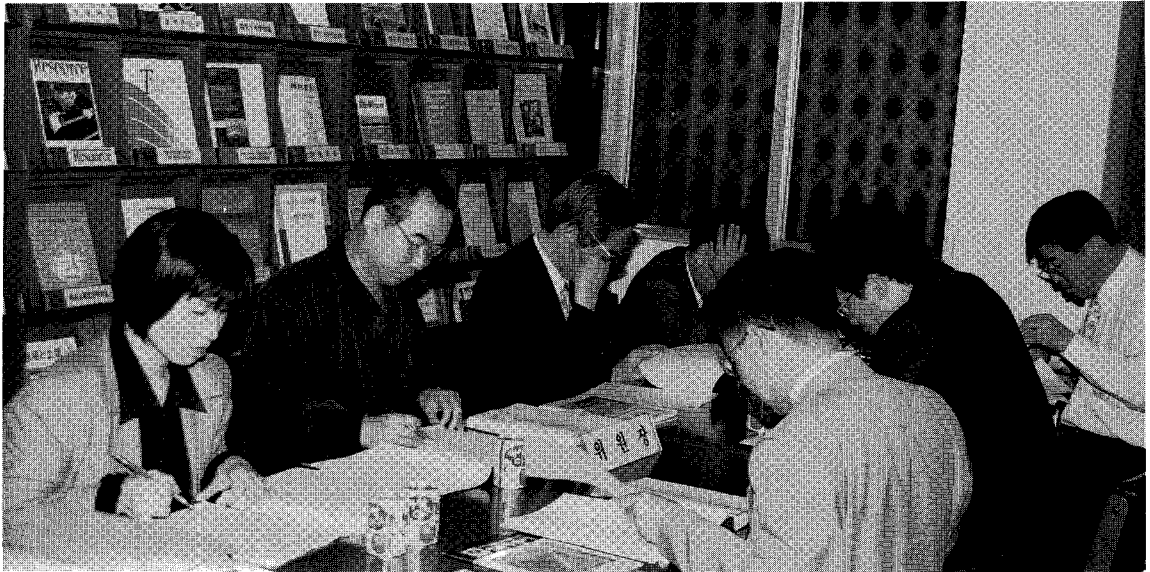
편집 및 학술분과위원회 회의