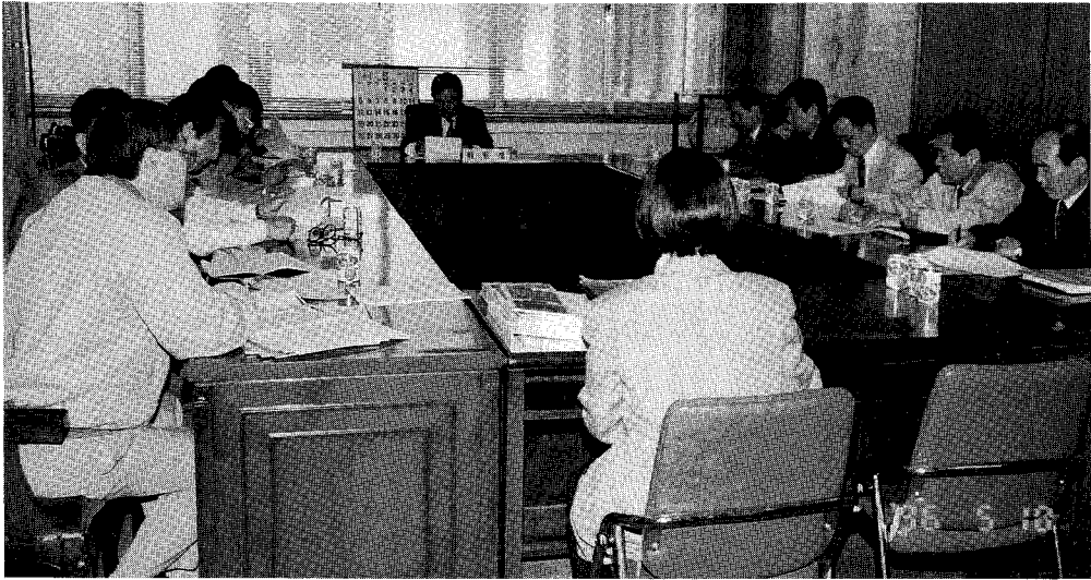
국제회의 유지 준비위 및 편집학술분과위원회 연석회의