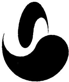
< 마크 I >