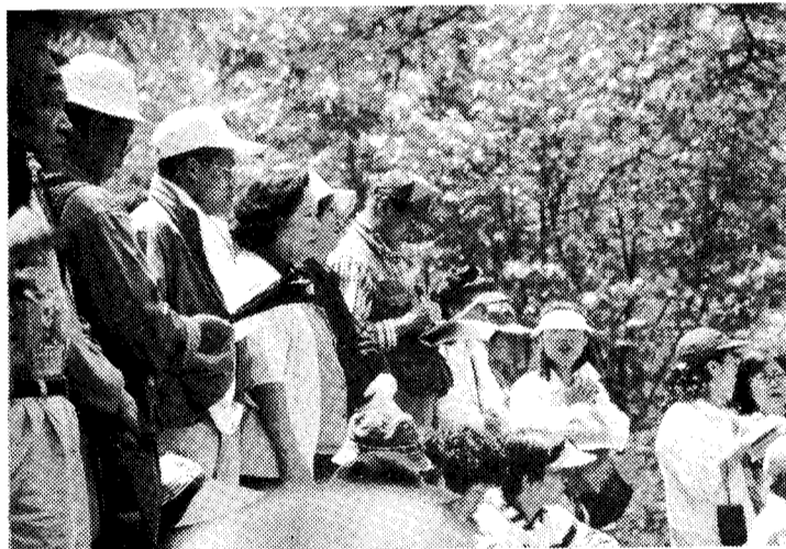
◇아는것이 힘! “하나라도 더 적어야지”