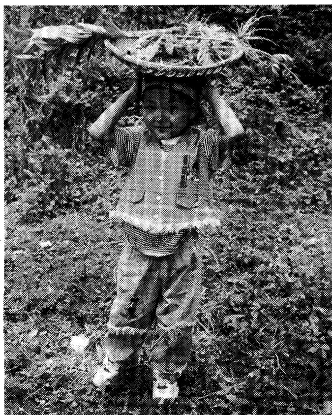
◇약초바구니 머리에 이고...