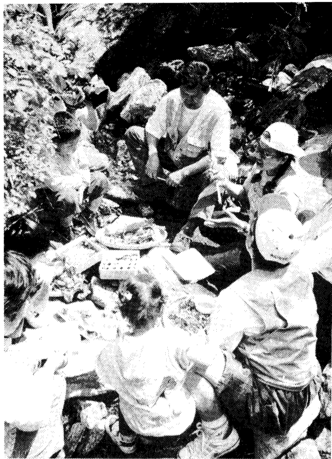
◇오색김밥에 곱취쌈으로 풍성한 오찬.