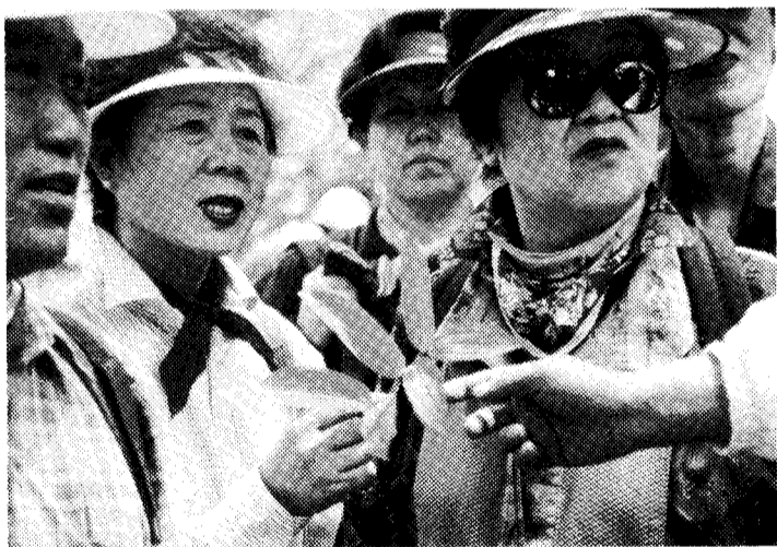
◇“이건 무슨 약초예요?”