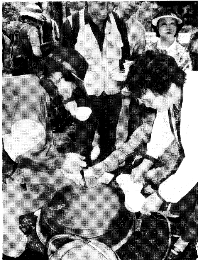
◇구수한 쪽국이 별미

사단법인 한국생약협회는 지난달 21일 경기도 양평군 소재 중미산에서 자연산 약초 서식지 답사 및 채취행사를 가졌다. 경희대학의대 안덕균 교수님을 초빙 다양한 생약초의 생태를 관찰하고 직접 채취도 한 이날 행사에는 2백50여명의 소비자들이 참여, 평소 우리 생약재에 대한 일반인들의 높은 관심도를 나타냈다.