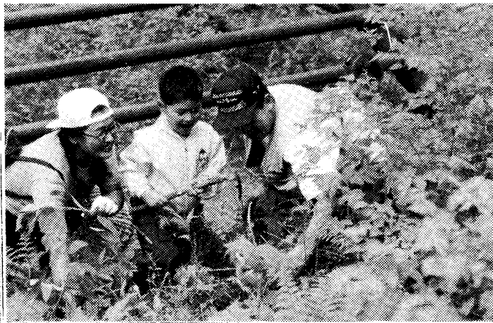
◇“저도 할 수 있어요”