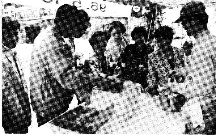
◇생약협회는 상설매장 개장 1주년 기념으로 약떡을 만들어 즉석시식회를 가졌다.

국산한약재상설매장 개장 1주년 기념 행사 행사가 지난달 10일부터 12일까지 3일간 제기동 소재 상설매장에서 열렸다.