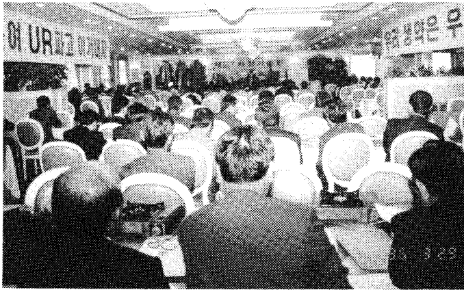
◇생약협회 제27차 정기총회가 지난달 29일 경동프라자에서 개최됐다.

△생약협회전시관 건립 추진 △생약협회서 신지현전시장 및 채집 △주요농산물개별 △제3회 우수생약업체 전시회 개최 △제2회 한계수련대회 및 한약제미나