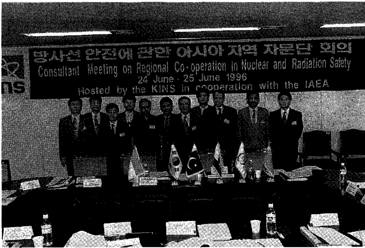
KINS에서 열린 방사선 안전에 관한 아시아 지역 자문단 회의(96. 6. 24~25)