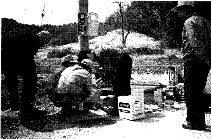
농업용 양수기 무상수리