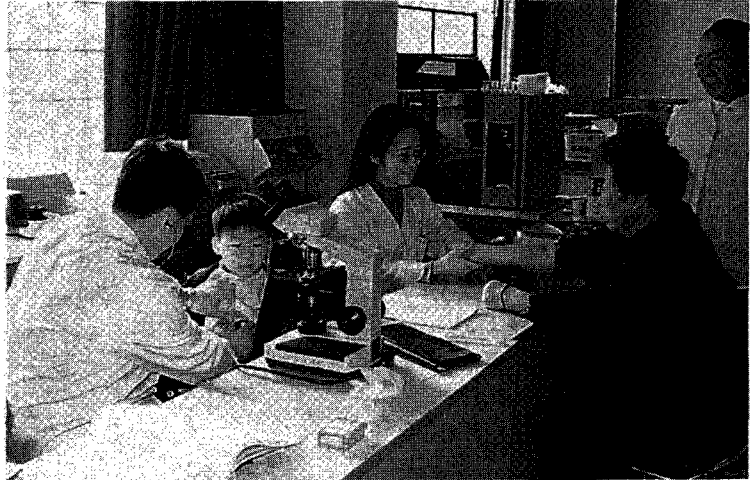
원전주변 주민들에 대한 무료의료활동

사업내용별로는 각종 홍보간행물 발간, 언론홍보 등 국민이해사업에 19억원, 문화행사·해외시찰 등 문화진 흥사업에 7억원, 원자력캠프, 원자력 동화 제작, 중등교사 워크숍 등 차세대교육사업에 5억원을 지원하게 되며, 기타 지역협력사업 및 국제협력사업 등에 17억원을 지원할 계획이다.