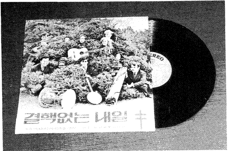
▲ 1969년 미국 평화봉사단 제1진중 10명이 귀국직전 그들이 작사 작곡한 "결핵없는 내일"을 비롯 한국의 민요 등 14곡을 수록한 음반을 결핵협회 서울지부 김대규사무국장 주선으로 (주)신세기 레코드에서 출판했으며 이익금은 결핵사업에 희사했다

나라의 힘이 되는 국민의 건강 발전과 생 산의 힘이여 내가 설마 하지말고 검진 받으면 결핵없 는 우리나라의 보다 나은 내일