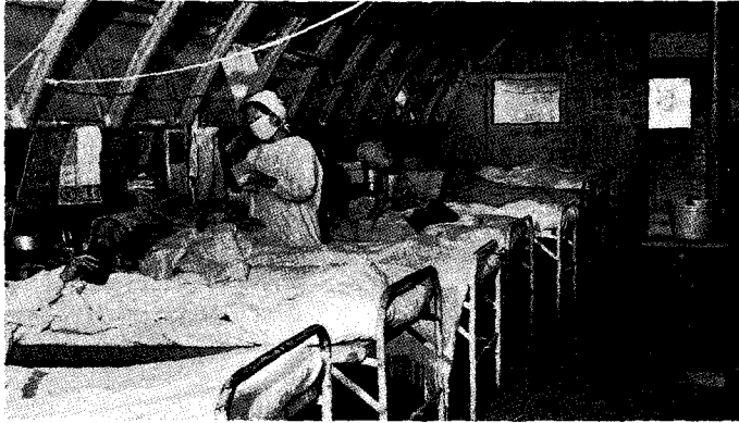
▲미국남장로교 한국선교회 의료선교사로 내한하여 6·25전쟁으로 급증한 결핵환자를 위해 1951년 광주제중병원을 개원한 Codington은 병실에 환자가 넘치자 미군으로부터 불하받은 퀸세트에 결핵환자를 수용하여 진료하였다. 광주제중병원 퀸세트 결핵병동, 1952.

윤유선(尹裕善) 박사가 범태평양결핵회의에서 발표한 내용에 의하면 전인구의 6.5%인 130만