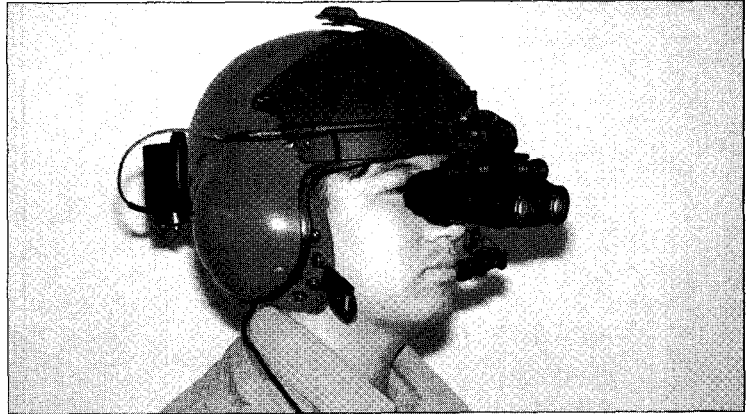
헬기 조종사용 야시경

열상장비에는 주사장치라는 것이 있어 관측하고자 하는 풍경을 모눈종이와같이 매우 많은 구간으로 나누어 부분 부분을 순차적으로 읽어와 다시 합성하여 한 영상 화면을 만든다. 움직이는 물체를 관측하기 위해서는 1초에 적어도 16회 이상(실제로는 25~30회) 화면을 만들어 주어야하므로 수평과 수직 방향으로 매우 빠르