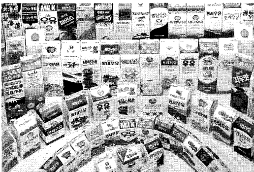
▲ 국내 유통 중인 우유 카톤팩

우유시장에 98% 이상을 의존하고 있는 종이팩은 81년부터 87년까지 타재질에서의 용기 교체에 힘입어 인해 20~45%의 연 신장률을 보였으나 그 이후에는 뚜렷한 성장세를 보이고 있