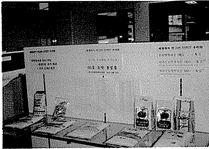
▲우리밀은 무농약의 안전하고 건강한 기능성 식품이라는 이미지로 홍보를 강화하고 있다.

한편, 우리밀베이커리의 홍보전략은 한마디로 특화된 점포를 가지고 틈새시장을 공략한다는 것이 전략의 핵심이다. 즉 '안전과 건강'이라는 기능성을 내걸고 전문성을 높인 특화된 점포를 통해 특정계층을 파고든다는 마케팅 기법이다.