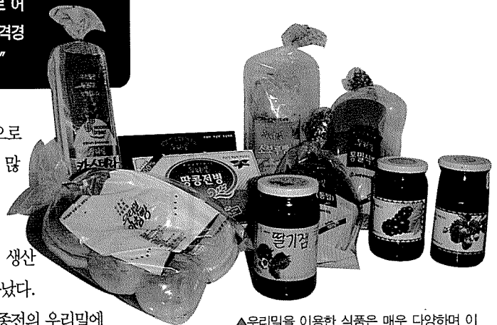
▲우리밀을 이용한 식품은 매우 다양하며 이미 각종 베이커리용 제품이 시판되고 있다.