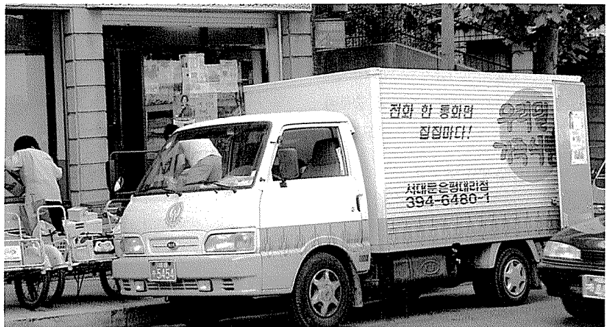
▲작년 9월 시작한 우리밀 식빵 택배사업은 기대했던 것과 달리 고전을 면치 못했다.

는 복안을 가지고 있다. 또한 강원, 충남북, 경남북, 전남북, 인천 등의 8개 지역분부를 기점으로 지방 가맹사업을 전개한다는 계획을 이미 세워놓고 있다. 그러기 위해서 우선적으로 경남 마산에 또하나의 본 공장 건립을 추진중에 있는 것으로 알려지고 있다.