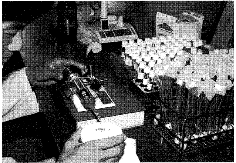
충제 미량국소 처리에 의한 멸구류, 나방류 해충의 저항성 발달정도 조사

살충제에 대한 저항성의 최초의 사례는 1908년 미국에서 산호제각지벌레가 석회유황합제에 저항성이 생긴 것이다. 그 이후 많은 종류의 해충이 여러가지 약제에 대해 저항성이 생긴 보고가 잇따르고 있다.