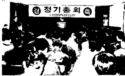
▲ 충남(한전 천안지점:1. 15)