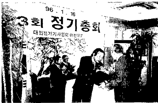
▶ 대전(새서울호텔: 1. 15)