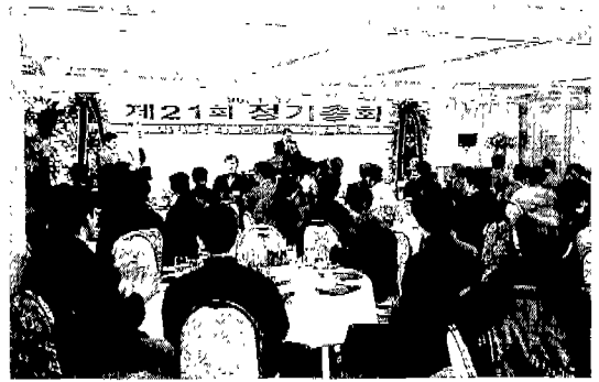
▶ 충청북(민우관광호텔: 1. 17)