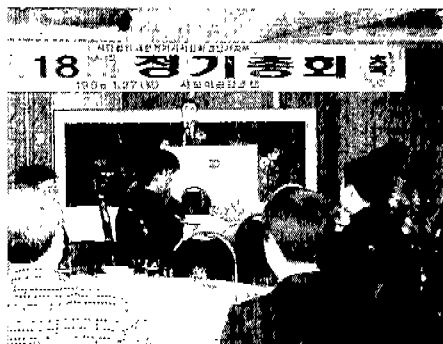
▲ 경남서(마산 사보이호텔: 1. 27)