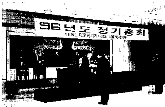
▲ 서울남서(보리차관예산장: 2. 2)