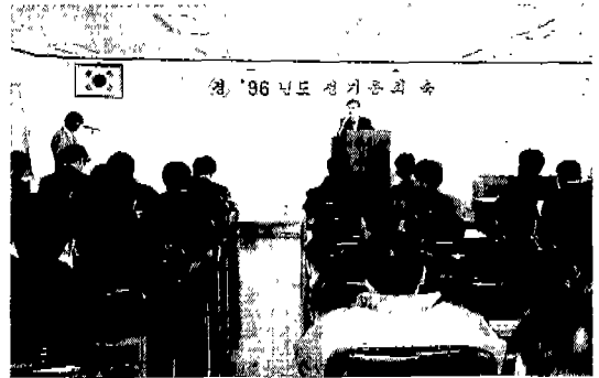
▶ 경북(울산 삼원회의소: 1. 22)