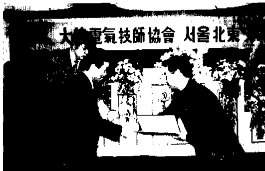
▶ 서울북동(해인명신관: 1. 20)