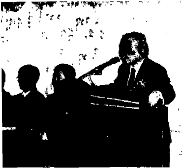
▲ 제주(로얄호텔:1. 14)