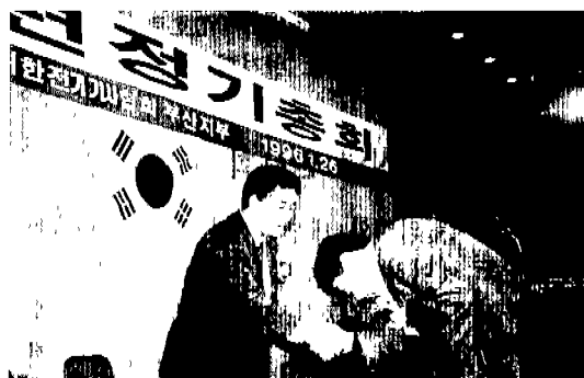
▲ 부산(부산대리사: 1. 26)