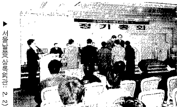
▲ 서울남서(신대호텔: 2. 2)