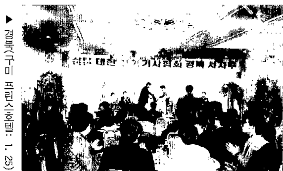
▲ 경북(구미 프린스호텔: 1. 25)