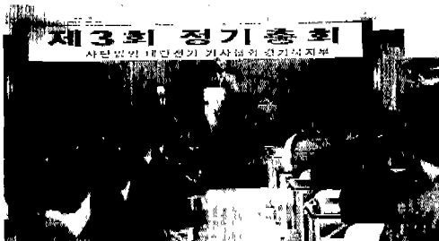
▲ 경기북(경기북부 상공회의소:1. 11)