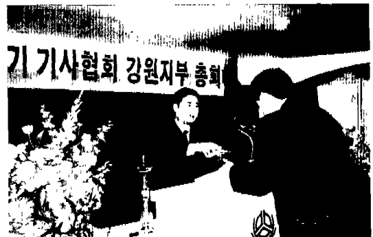
▲ 강원(강릉 신협회관:1. 12)