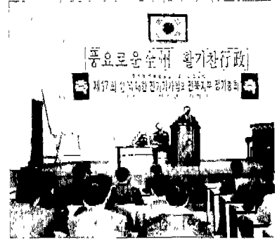
▲ 전북(전주 근로청소년회관:1. 18)