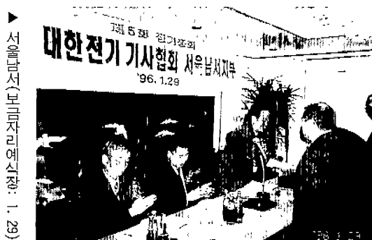
▲ 서울남서(보리차관예산장: 1. 29)