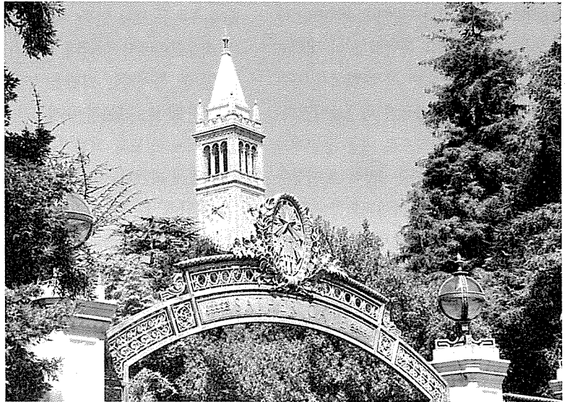
▲버클리대 SATHER GATE 뒤로 보이는 시계탑

1992년에 보고된 US News & World Report지에 의하면 미국내 대학의 인문사회대학원 교육에서는 전 학문분야에서 학술적인 우수성으로 1위를 차지했으며 그 다음이 스탠포드, 하버드, 시카고의 순으로 평가를 받고 있다. 1996년판 US News & World Report지의 America's Best Colleges에 의하면 버클리대학의 학술적인 우수성 평가는 하버드, 스탠포드, MIT의 공동 1위에 이어 예일 및 프린스턴대학과 공동으로 2위를 차지하고 있다.