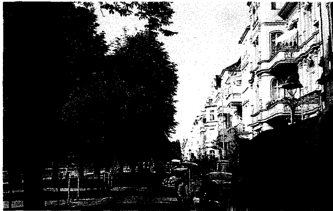
▲원형시내 주택가와 차도사이에 띠 숲을 조성하여 소음을 감소하고 경관을 보호한다.