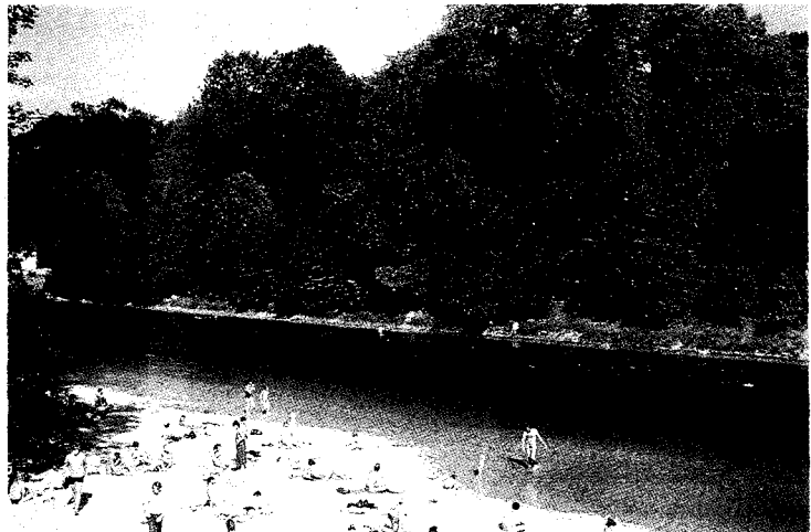
▲원천시 외곽을 흐르는 강 주변의 수자원 보호림과 일광욕을 즐기는 시민

•학술적으로 희귀하거나 멸종 위기에 있는 동식물이 있는 곳은 최소한 휴양이용에서 제외시킨