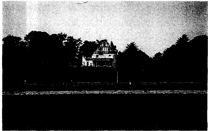
▲라인강변의 주택근처의 휴양림

휴양기능의 증진과 보존을 위하여 숲 가장자리에 활엽수와 관목류의 비율을 높게 조성한다. 특히 눈에 잘 띄게 꽃이 피고 가을에 단풍이 잘 드는 수종을 선정한다. 음지와 양지, 색, 형태의 다