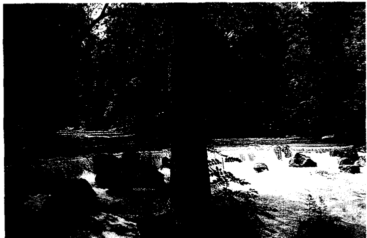
▲ 원천시 한복판에 있는 English 공원내 수자원 보호림과 깨끗한 물.

• 벌채와 숲 가꾸기는 휴양객수가 적을 때 실시하여 안전사고를 방지하고 작업능률을 올린다.