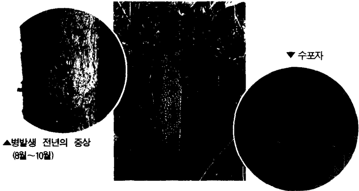
▲병발생 전년의 증상 (8월~10월)

○병징 : 병원균에 감염된 수피는 황색~등황색으로 변하고, 2년 후에는 적갈색으로 변하면서 방추형(紡錘形)으로 부풀며, 8월이 되면 표면에 황색의 점질상 물방울(精子)이 나타난다. 이듬해 4~6월이 되면 수피를 뚫고 백색막에 쌓인 수포자퇴(銹孢子堆)가 분출한다. 수포자퇴는 곧 터져 수포자가 비산한다. 수포자가 비산한 6월 이후의 환부는 수피가 건조하