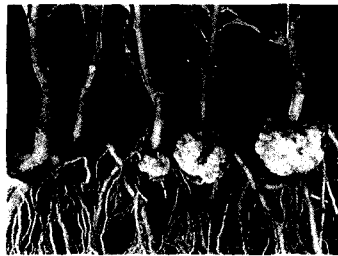
▲밤나무 유대점목묘에 발생한 뿌리혹병

○피해 : 이 병을 일으키는 세균은 상처를 통하여 전염되므로 점목묘를 많이 이용하는 밤나무, 감나무, 과수묘목과 삼목으로 증식하는 포플라에 많이 발생한다. 병든 나무는 급히 말라 죽지는 않