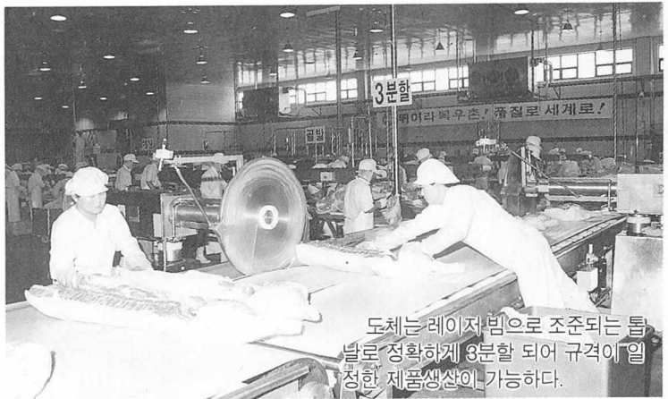
도체는 레이저 빔으로 조준되는 틈 발로 정확하게 3분할 되어 규격이 일 정한 제품생산이 가능하다.

어 샤워실을 통과하여야 하고 돼지도체는 레이저 빔을 발사 하여 3분체로 정확한 부위를 분 할한 다음 부위별로 정형작업 을 한다.