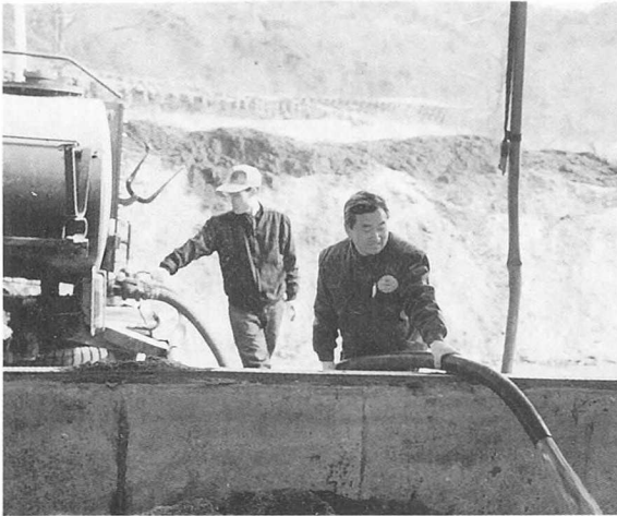
▲ 돼지분뇨가 발효되면 양질의 비료가 된다구.