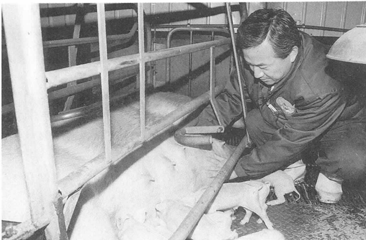
◀ 무럭무럭 자라서 우리 양돈농가들을 행복하게 해주렴.