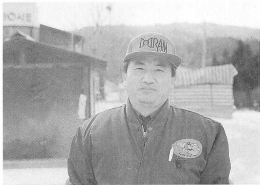
◀ 강운태 농림수산부장관의 모습

이날 방영을 위하여 지난 2월 1일 강운태 농림수산부장관은 경기도 이천군에 있는 인화농