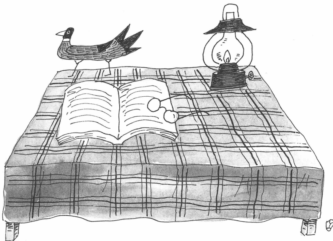
일러스트레이션 / 노희성

내 기억으로는 수십권의 세계문학전집을 시리즈로 내어서 우리나라 사람들에게 세계 각국 문호들의 작품을 고루 섭렵할 수 있게 해주었던 것도 그 출판사가 처음이 아니었던가 한다. 단지 처음이라는 의미 말고도 그 내용의 충실함 또한 다른 출판사의 모범이 되었다. 아버지께서 그