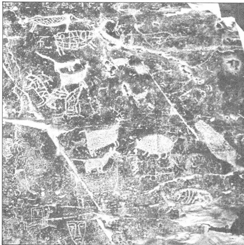
울주 대곡리 반구대 암각화.

암각화를 통해 신석기 시대 이후 청동기 시대의 신앙의례도 엿볼 수 있다. 고인돌시대의 암각화는 대체로 농경의 풍요와 생산을 기원하며, 청동기 시대 석검 석촉은 남성신을, 여성의 신체를 기하학적으로 묘사