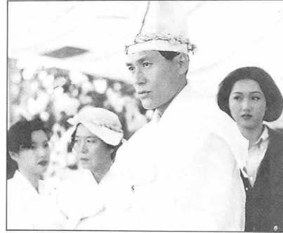
영화 〈축제〉와 〈유리〉의 한 장면.

박상룡·이청준·최윤 등 중견작가들의 원작을 영화화한 세편의 작품이 복잡다기한 관심을 불러일으키고 있다. 이 영화들은 모두 인간사의 영원한 숙제인 '생성과 소멸'의 구도를 밑그림으로 깔고 있기 때문이다.