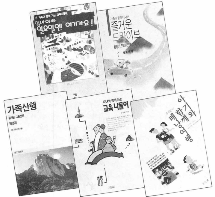
가족과 함께 할 수 있는 나들이 안내서들.

가족들과 함께 통일로를 따라 임진강쪽을 달려보면 어떨까. 열두굽이가 휘어져 오르내리면서 계속마다 다리가 놓인 파주의 설마령을 달리다 보면 주변의 아름다운 경치에 탄성이 절로 난다. 《가족과 함께 떠나는 즐거운 드라이브》(최동욱 지음, 정우사)는 비교적 짧은 시간에 드라이브를 즐길 수 있는 환상적인 코스를 소개한다. 근거리 세부도를 중심으로 하여 서울 및 주요 지방의