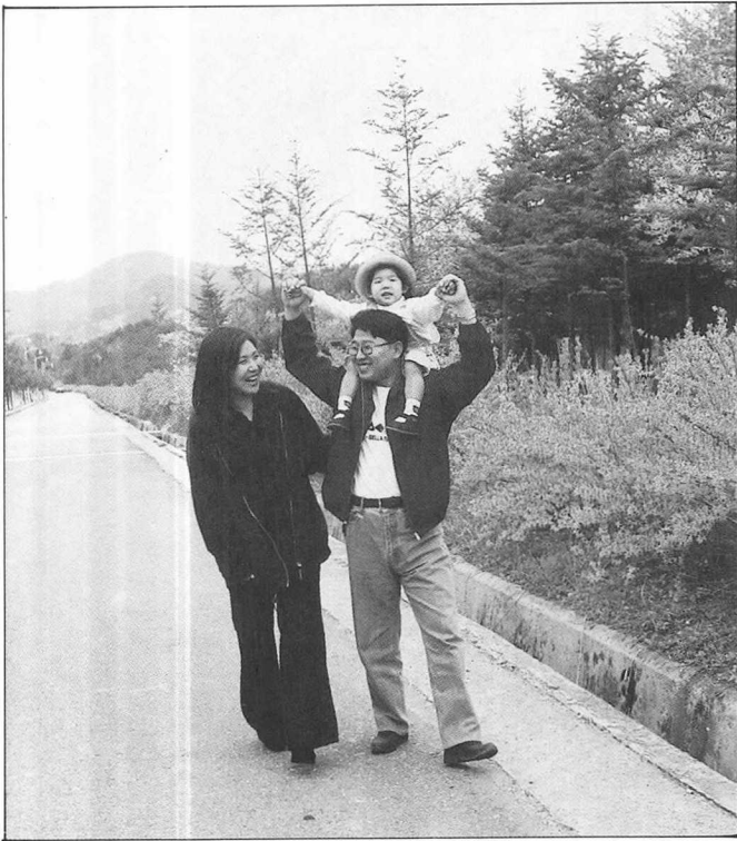
가정의 달을 맞아 가족의 의미와 사랑을 깨우치는 책들이 눈길을 끈다.

아닌 평등과 개성이 강조되는 현재의 실정과 개념에 맞게 서술하고 있어 눈길을 끈다.