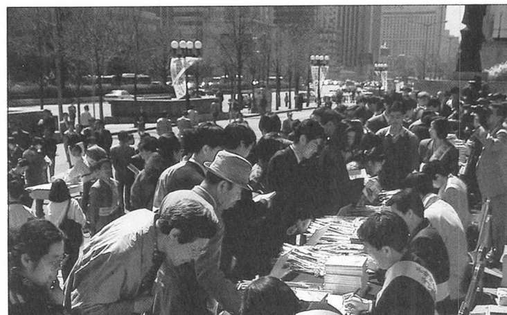
지난 23일 세종문화대강당 앞에서 가진 기념행사.

유네스코가 제정한 '세계 책과 저작권의 날'을 맞은 지난 23일 오전 서울 세종문화회관 대강당 앞에서 기념행사가 열렸다. 이날 대강당 앞에서는 책 3천권과 장미꽃 1천송이, 책갈피 1만개를 시민들에게 무료로 나눠주었다. 또 소설가, 수필가 등 30여명의 작가들이 나와 사인회를 갖기도 했다.