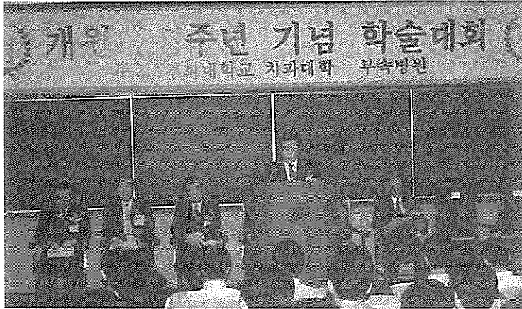
▲ 학술대회 장면

경희대학교 부속병원인 경희의료원은 개원 25주년 기념 하여 치과병원 학술대회를 지난 10월 12일에 개최하였다.