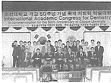
▲ 학술대회 장면