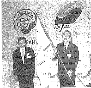
FDI 서울총회 후원의 밤 및 연맹 기 인수식이 11월 2일 오후5시 프