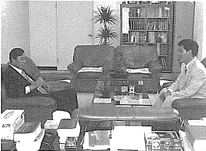
김현수 청주시장이 지난 9월