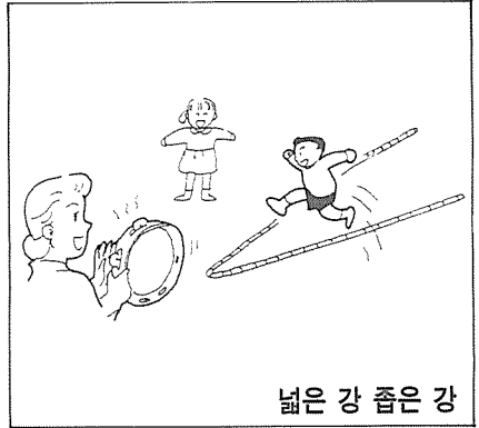
넓은 강 좁은 강